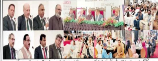
حب تکینیکل سینٹریف ہسپتال کی افتتاحی تقریب سے وزیر اعلیٰ بلوچستان کے شیر عورت و فرادی قوت لو ایڈوو گرامنٹان آئی، عزیزین قوتعلیت کراچی کے قوصل جزل ڈاکٹرونگیکری بلوچستان صحت و فرادی قوت طارق مسز MIC OVIDIU مسز او ایڈووکلن و دیگر مقررین خطاب کر رہے ہیں