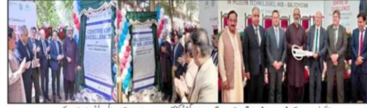
وزیر اعلیٰ بلوچستان کے شیر عورت و فرادی قوت لو ایڈوو گرامنٹان آئی تکینیکل سینٹریف ہسپتال کی افتتاحی تقریب سے ہیں