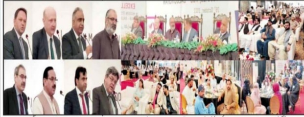
جب بینکنگ سینٹر جب میں سینئر آف ایسی ایس کی افتتاحی تقریب سے وزیر اعلیٰ بلوچستان کے مشیر صحت و فراہمی قوت نواز ابراہیم گرام خان ٹی، جرنل توصلیٹ، کراچی کے قونصل جنرل ڈاکٹر رولڈ ٹھاکر، سیکرٹری بلوچستان صحت و فراہمی قوت طارق مرشد OVIDIU MICRUSٹر اور ایڈیٹر ان چیف ڈوگٹر مقررین خطاب کر رہے ہیں