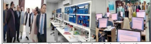
حب وزیر اعلیٰ بلوچستان کے شیر عورت و فرادی قوت لو ایڈوو گرامنٹان آئی، عزیزین قوتعلیت کراچی کے قوصل جزل ڈاکٹرونگیکری بلوچستان صحت و فرادی قوت طارق مسز MIC OVIDIU مسز او ایڈووکلن و دیگر تکینیکل سینٹریف ہسپتال کے موقع پر مختلف شعبہ جات کا سٹارٹ کر رہے ہیں